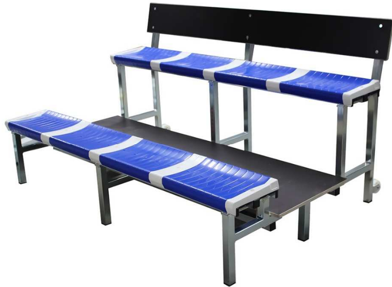
IMAGEN Y DIMENSIONES