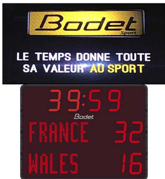
BT2025 Alpha + Pack 3A vidéo