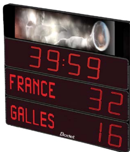
BT2045 Alpha + Pack 3B vidéo