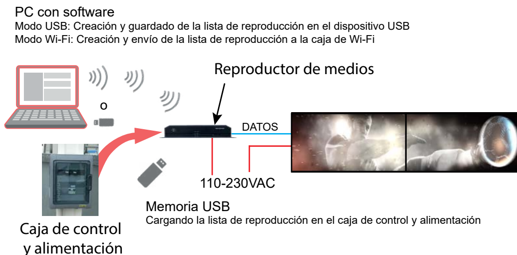
Gráfico de cableado

• Estos packs incluyen los módulos de video y la caja de control y alimentación con el reproductor de medios.